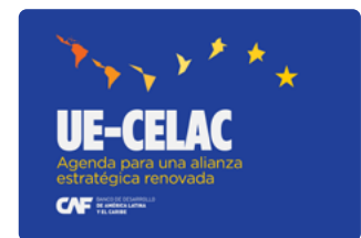
UE-CELAC (América Latina y el Caribe: una sola voz). Santiago de Compostela, 2023.