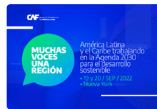
Muchas voces, una región (UNGA). Nueva York, 2022.

Como parte de la acción de CAF, el banco promueve espacios de reflexión para elevar la voz de América Latina y el Caribe en el contexto global , y generar oportunidades de colaboración con otras regiones.