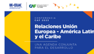
Conferencia CAF en Europa. Madrid, 2023.