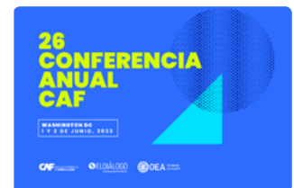
Conferencia CAF Washington DC