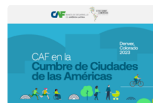
Cumbres de ciudades (Los Angeles y Denver)