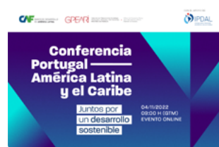
Conferencia América Latina-Portugal. Lisboa, 2023